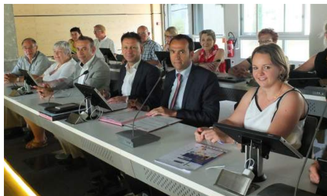
Signature de la convention de partenariat entre Initiative Loir-et-Cher et Agglopolys, le 3 juillet 2015 à Agglopolys.

Pour connaître les financements proposés par l'association : initiative-loir-et-cher.fr